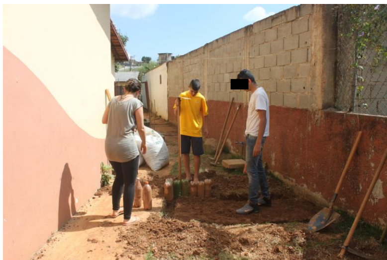
Figura 3. Alunos fazendo a delimitação dos canteiros com garrafa pet.

Na etapa seguinte, fez-se o preparo dos canteiros e do solo. Com o auxílio de uma enxada, revolveu-se a terra para retirar vestígios de raízes que poderiam prejudicar o desenvolvimento das