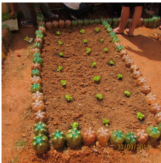
Figura 4. Canteiro logo após o plantio das mudas.

mudas a serem plantadas. Para o preparo do solo, foi necessário fazer a adubação e correção, pois a terra utilizada era argilosa, formada por pequenos grãos de areia, bem ligados entre si, que provocam alta retenção de água e compactação, dificultando o desenvolvimento das plantas, além de ser ácida. Esses processos foram feitos adicionando-se cal e esterco curtido à terra, deixando-a descansar por uma semana. Na sequência, foram plantadas mudas de hortaliças: salsinha, cebolinha, alface lisa, alface crespa e rúcula (Figura 4).