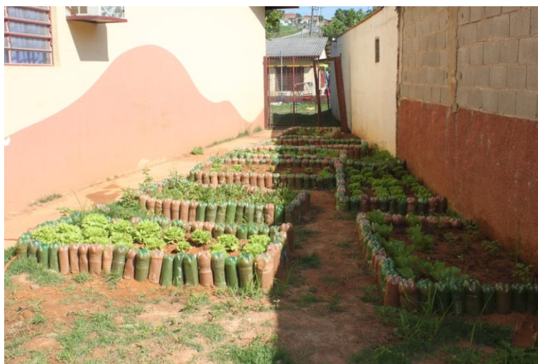
Figura 5. Vista geral dos canteiros durante a fase de manutenção.

A partir daí, organizou-se o manejo da horta, onde em cada dia da semana, um grupo de alunos era escalado para cumprir as tarefas de regar os canteiros de todas as salas, retirar as plantas invasoras e observar se havia algo de errado com o canteiro e/ou com as plantas (Figura 5).