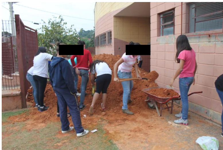
Figura 2. Alunas enchendo as garrafas de terra para cercar o canteiro.

A ideia inicial era encher as garrafas PET com água, mas os alunos sugeriram o preenchimento com terra, devido à crise hídrica. Ela foi peneirada antes para facilitar sua colocação no interior das garrafas (Figura 2). Posteriormente, as garrafas foram encaixadas, com o gargalo para baixo, na vala anteriormente cavada formando, assim, uma cerca (Figura 3).