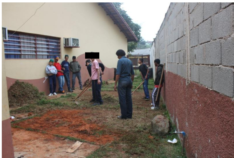
Figura 1. Alunos fazendo a limpeza do canteiro.

A primeira etapa foi a limpeza do terreno: capinou-se o mato e retiraram-se as pedras, garrafas PET antigas, saquinhos de salgadinhos e outros entulhos e lixos (Figura 1).